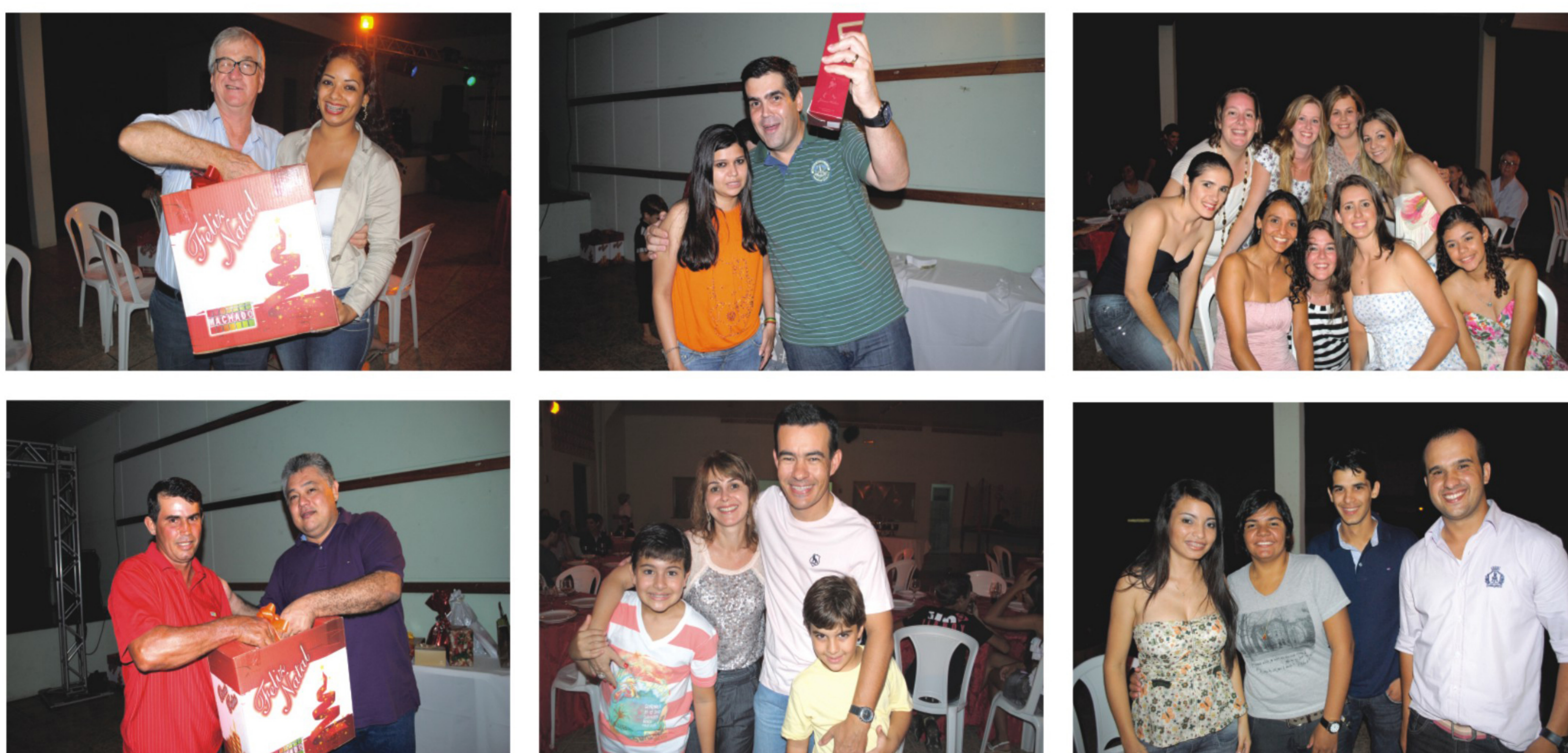
Confraternização de Natal da CDL