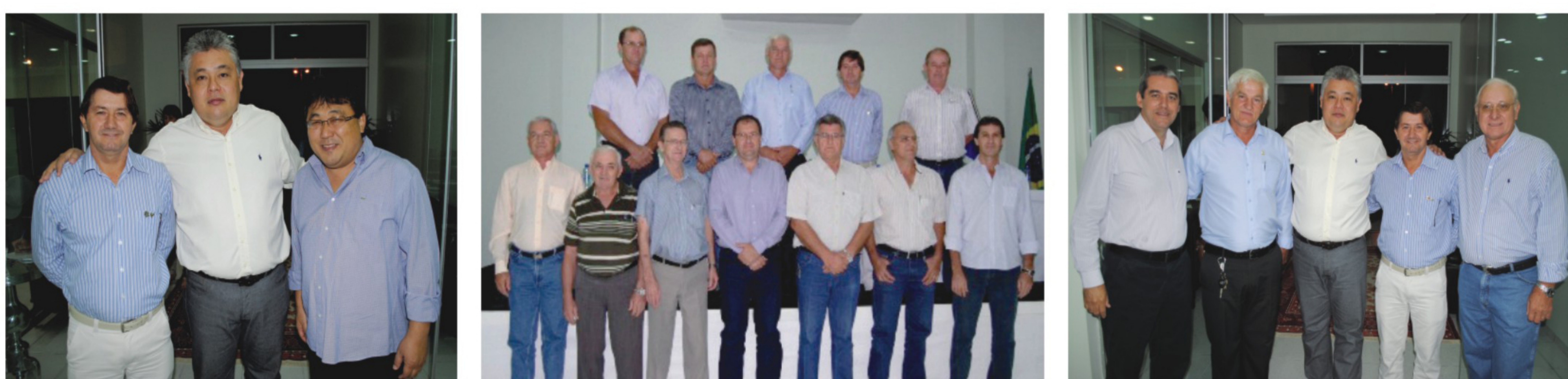
Sindicato Rural realiza posse festiva da nova diretoria