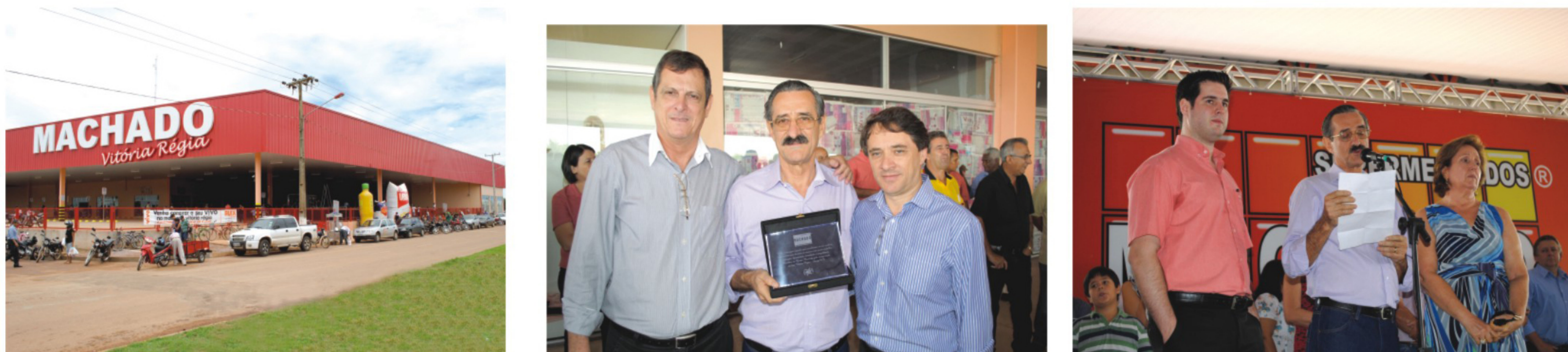
Supermercado Machado inaugura a sexta loja do grupo