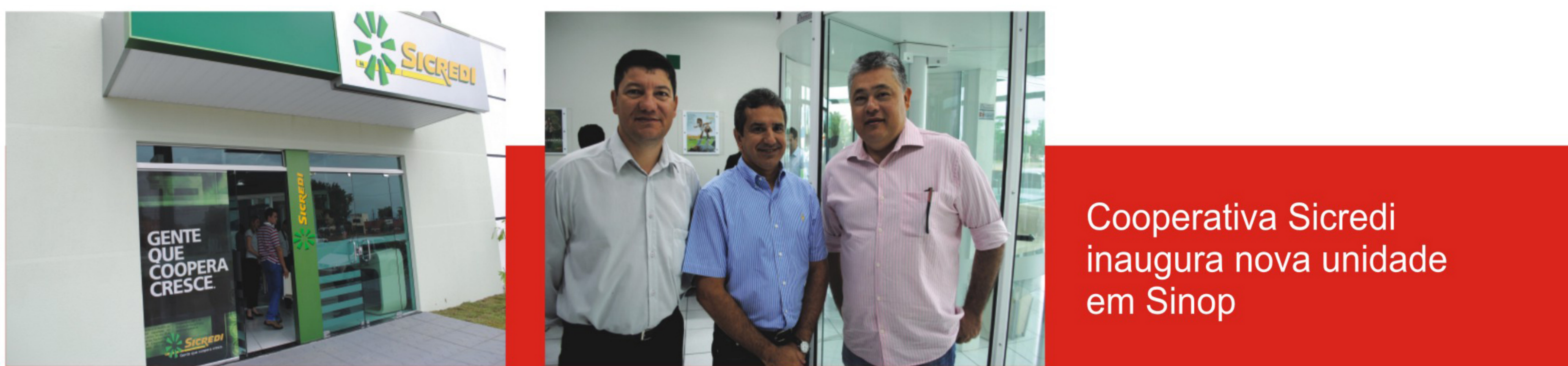
Cooperativa Sicredi inaugura nova unidade em Sinop