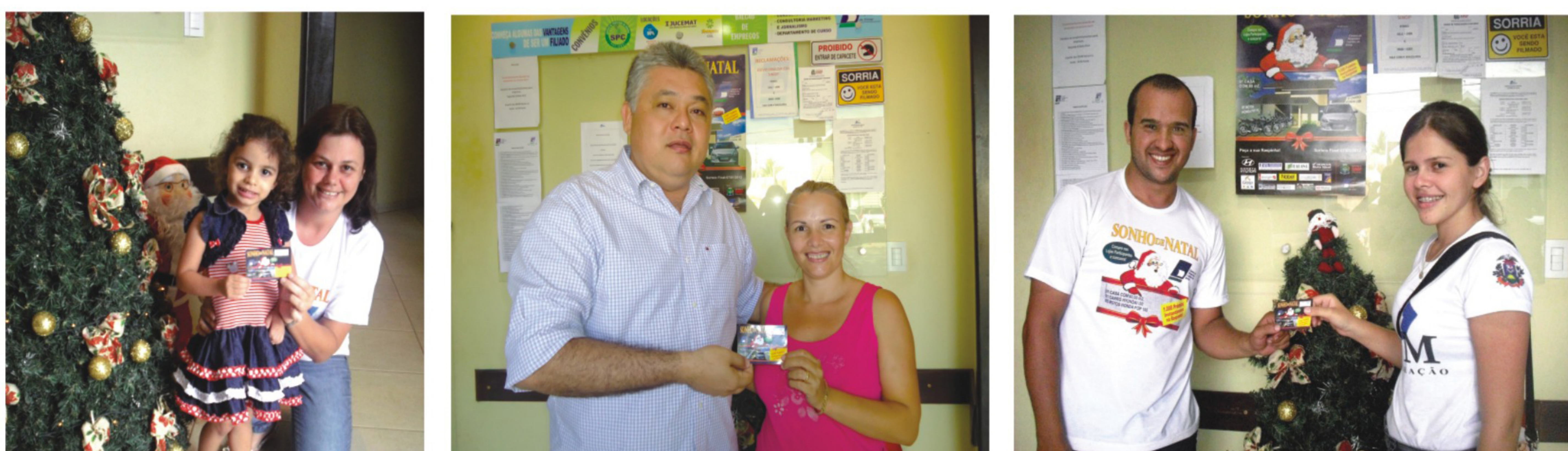
Centenas de pessoas estão recebendo prêmios nas raspinhas do Sonho de Natal