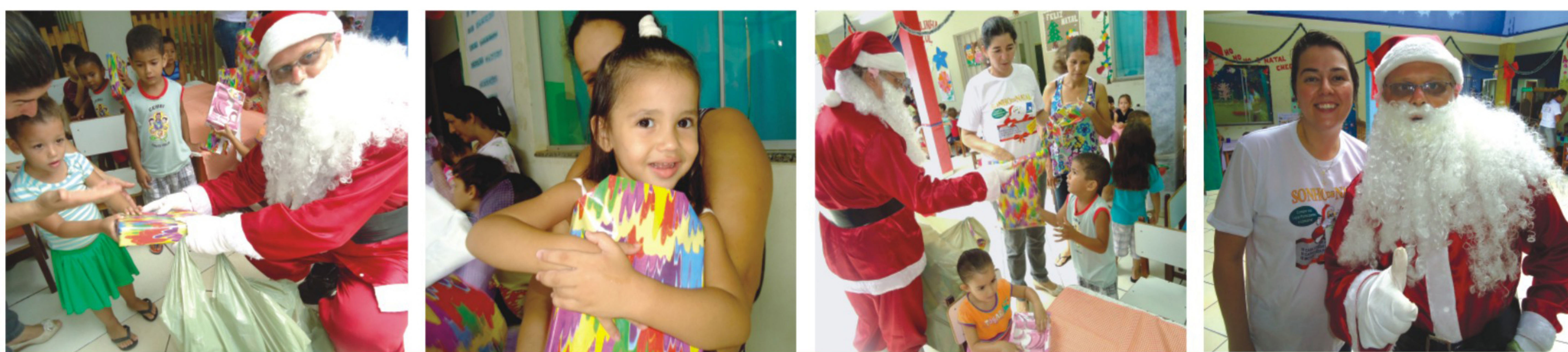
CDL promove o Natal na Creche Gente Feliz