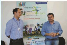
CDL apoiou e participou ativamente do Fórum de Sustentabilidade