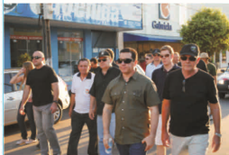
Dia do Basta – Empresários e estudantes marcham contra corrupção