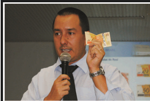
Palestra sobre Dinheiro Falso com Perito da Polícia Federal