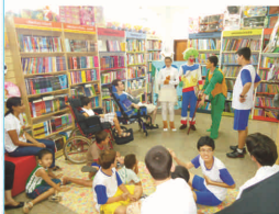
Dia do Livro - Apae visita Livraria Nobel