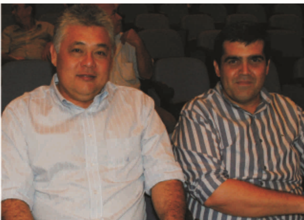
Prodac 3 – CDL testemunha lançamento do Pacote de Obras da Prefeitura