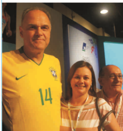
CDL Sinop no 79º Seminário Nacional de SPCs em Brasília