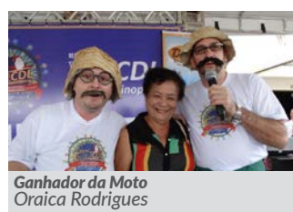
Ganhador da Moto Oraica Rodrigues